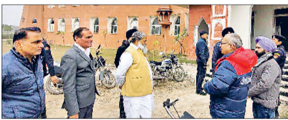
अंबाला। शहीद स्मारक का मुआयना करते गृहमंत्री अनिल विज।

शहीद स्मारक का सिविल वर्क अंतिम चरणों में, गृह मंत्री विज ने निर्माण एजेंसी के स्टाफ से प्रगति जानी