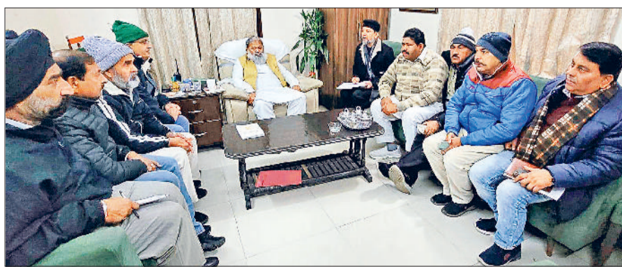
अंबाला। पार्टी पदाधिकारियों को जरूरी निर्देश देते गृहमंत्री अनिल विज।

गृह एवं स्वास्थ्य मंत्री अनिल विज ने कहा कि अयोध्या में भगवान श्रीराम मंदिर में प्राण-प्रतिष्ठा के उपलक्ष्य पर अंबाला छावनी में आगामी 14 को भव्य श्रीराम यात्रा का आयोजन किया जाएगा। विज शुक्रवार दोपहर श्रीराम यात्रा की तैयारियों को लेकर अपने आवास पर आयोजित बैठक को संबोधित कर रहे थे। उन्होंने कहा कि 14 जनवरी को श्रीराम यात्रा प्रातः 11 बजे सुभाष पार्क से पैदल निकाली जाएगी जोकि छावनी के प्रमुख बाजारों से होती हुई वापस सुभाष पार्क पर संपन्न होगी। यात्रा सुभाष पार्क से आउटर लाज रोड तक फिर यहां से कबाड़ी बाजार मुड़ते हुए