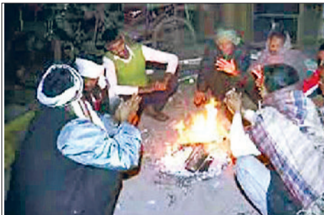
यमुनानगर में शुरुआत को सुबह के वक्त घने कोहरे के बीच सड़कों पर रंगते वाहन व अलाव जलाकर आग संकेत हुए

की। शुरुआत सुबह जिले में आसमान से कोहरे के बूंदें और बादलों से कोहरा शुरू हो गया है। जससे मौसम में अधिक ठंड बढ़ गई। शीतलहर चलने से लोग घरों में दुबकने को मजबूर हो गए। आलम यह रहा कि