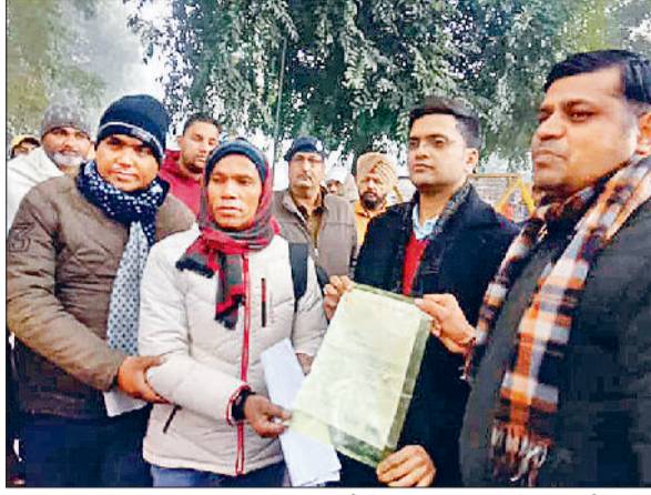
यमुनानगर। के जिला सचिवालय में मुख्यमंत्री के नाम ज्ञापन सौंपते हुए ग्रामीण ट्यूबवेल ऑपरेटर।

भारतीय मजदूर संघ के बैनर तले ग्रामीण ट्यूबवेल ऑपरेटरों ने अपनी मांगों को लेकर शुक्रवार को जिला सचिवालय के समक्ष जोरदार प्रदर्शन किया। मौके पर उन्होंने सरकार के खिलाफ जमकर नारेबाजी की। इस दौरान उन्होंने मुख्यमंत्री के नाम एसडीएम जगाधरी को ज्ञापन सौंपकर उनकी मांगे जल्द पूरी किए जाने की मांग की। साथ ही उन्होंने मांगे पूरी नहीं किए जाने पर बड़ा आंदोलन किए