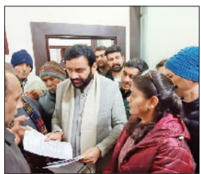
कुरुक्षेत्र। मांगों का ज्ञापन सौंपते हुकटा के पदाधिकारी।

हरियाणा यूनिवर्सिटीज कॉन्फ्रेंस अल टीचर्स संघ, हरियाणा (हुकटा) ने राज्य सरकार से मांग की कि प्रदेश के विश्वविद्यालयों में कार्यरत अस्थायी अतिरिक्त प्रोफेसर्स के लिए सरकार पॉलिसी या विशेष केंद्र बनाकर उनका रोजगार सुरक्षित करे। ये अस्थायी अतिरिक्त प्रोफेसर रिक्त पदों पर लंबे समय से काम कर रहे हैं। अब स्थायी भर्ती की प्रक्रिया से उन पर छंटनी की तलवार लटक गई है। संघ सभी पालटव के संसदों, विधायकों व अन्य मंत्रिमंडल के नेताओं को रोजगार सुरक्षित करवाने की पॉलिसी बनाने के लिए पत्राचार