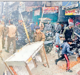
पानीपत की सनौली रोड से अतिक्रमण हटवाते हुए पुलिस टीम।

दौबारा से सनौली रोड पर पहुंचकर अतिक्रमण हटवाकर फुटपाथ को खाली करवाया। ट्रैफिक पुलिस टीम द्वारा वीरवार को सनौली रोड से अतिक्रमण हटवाने के साथ ही दुकानदारों को विशेष रूप से हिदायत दी गई थी कि वे दौबारा से