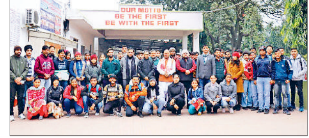
अंबाला। व्याख्यान के दौरान कॉलेज के छात्र व शिक्षक।