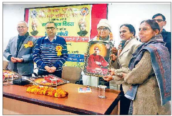
यमुनानगर। के महाराजा अग्रसेन कॉलेज में आयोजित विचार गोष्ठी में मुख्यातिथि को स्वामी विवेकानंद की प्रतिमा भेंट कर स्वागत करते आयोजक।